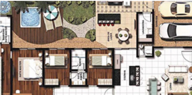
Ilustración de Planta Composición Arquitectónica

Conociendo las herramientas que posee Adobe Photoshop para la ilustración de plantas arquitectónicas con un acabado que tenga impacto al cliente.